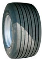
Одиночная колёсная база