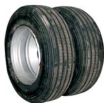
Двойная колёсная база