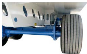
Компонент рамы стандартной серии