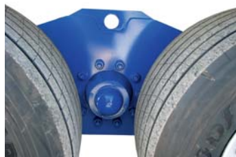
Шагающая ось стандартной серии (Опция)