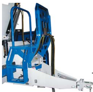
Смотровая площадка, крепящаяся на болтах к раме корпуса (Опция)

Все шнеки системы Торнадо оснащены тремя уникальными, зубчатыми, ультратонкими ножами, имеющими различную конфигурацию лезвия. Три различных типа ножей обеспечивают эффективное измельчение различных видов фуража в зависимости от кормовых потребностей рациона, будь-то сено, силос, солома или сенаж.